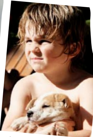
Lievelingsdier? Thaise puppies!