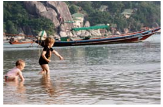
Acclimatiseren op Koh Tao. In Nederland is de winter echt begonnen.

Nadat we in Bangkok zijn geacclimatiseerd, is het tijd voor het eerste belangrijke onderdeel van de trip: even lekker uitrusten. Dus op naar zon, zee en strand! Eenmaal op Koh Tao blijkt dat wennen aan het ritme toch wat langer duurt dan we dachten. Niet zozeer het tijdsverschil, maar de reis zelf en de veranderde