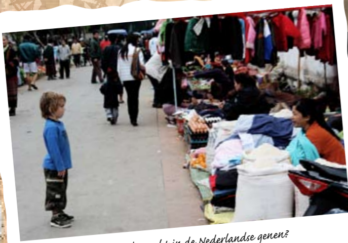
Zit 'kijken niet kopen' dan echt in de Nederlandse genen?

We hebben oog voor dingen uit het dagelijks leven die we anders niet zouden zien. Zo wordt elke mier aandachtig bekeken.