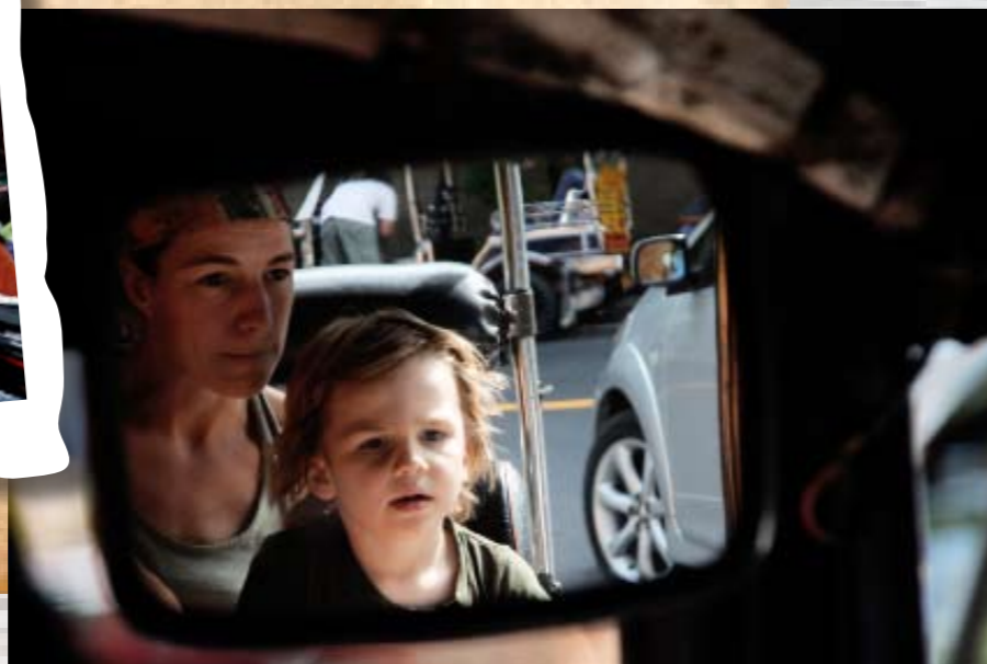
Taxi, minivan, touringcar, pick-up truck... De tuktuk is favoriet.

Een tweede verschil is het tempo van reizen. Vooral als je zonder kinderen al flink en intensief gereisd hebt (twintig uur in een doorgezakte stoel van een trilbus met open ramen over zandwegen van Mexico naar Guatemala: heerlijk...) Op de meeste plaatsen zijn we één of twee dagen langer dan de reisgidsen adviseren. Soms doen we een dagje niets anders dan uitrusten, kleuren, met autootjes spelen, lekker eten en een wasje. Het lagere tempo - korte beentjes gaan nu eenmaal langzamer - is voor ons een mooie toevoeging aan de reis.