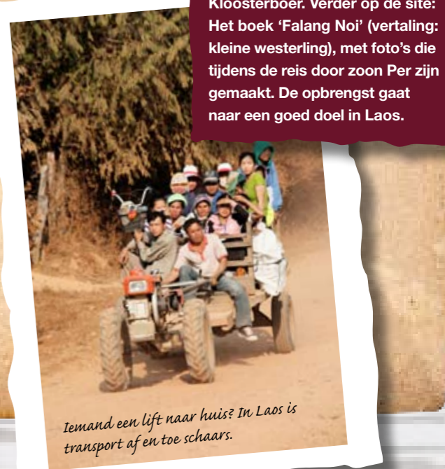
Iemand een lift naar huis? In Laos is transport af en toe schaars.