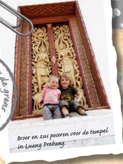
Broer en zus poseren voor de tempel in Luang Prabang.